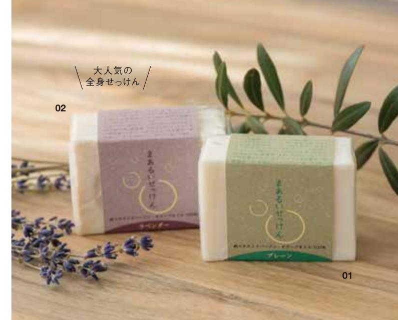
※オリーブの果皮(黒い粒子)が入っていることがありますが、品質に問題ありません ※手作りのため固体差があります

オリーブオイルには、お肌にうるおいを与える脂肪酸のオレイン酸やリノール酸などが含まれているため、肌に自然になじみ、保湿効果も高く、お肌しっとりツヤツヤの洗い上がり。赤ちゃんから大人まで、デリケートなお肌の方にもおすすめです。